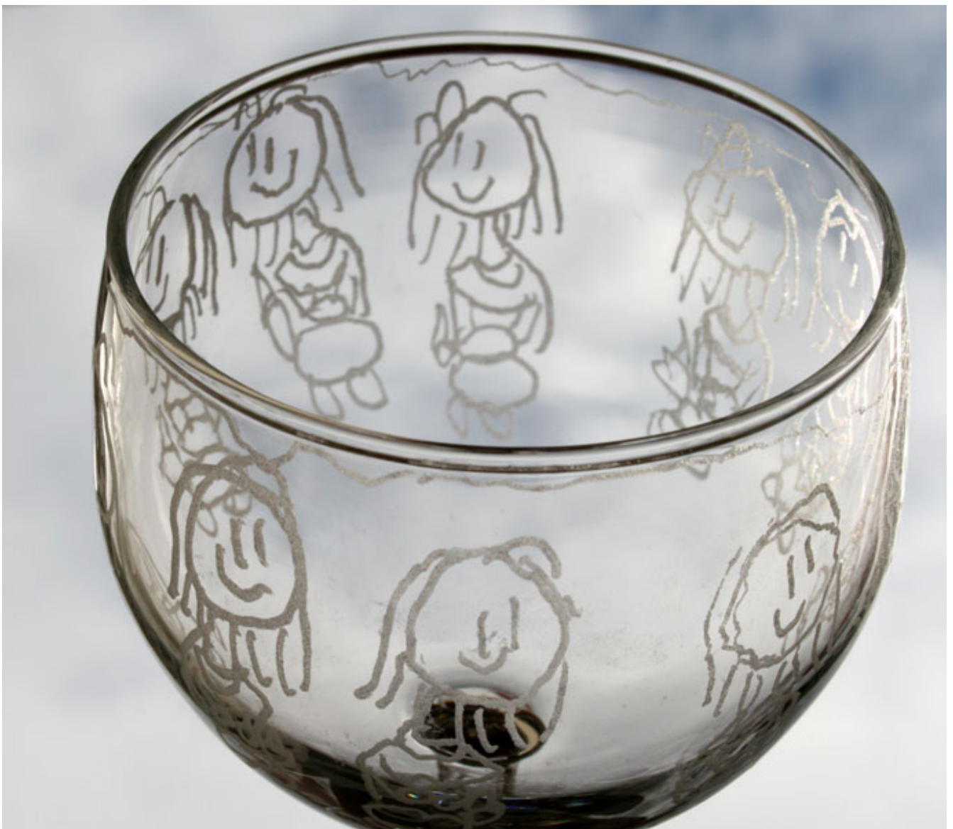
Govva: Davvi-Norgga dáiddaguovddáš