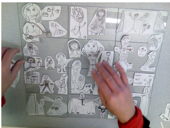
Govva: Davvi-Norgga dáiddaguovddáš

Prošeavtta bokte oahppit hástaluvvojit geavahit iežaset miellagovahallama, ovttasbargoattáldagaid ja jurdagiid mat čatnasit identitehtaáššiide. Oahppit sáhttet skuvllas ráhkadit čájáhusa gos čájehit iežaset barggaid, dahje váldit daid ruoktut.