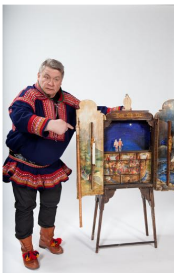
Govven/Foto: Aslak Mikal Mienna

ELEVTRANSPORT: eventuell transport på denne turneen dekkes av KOMMUNEN SELV. Kontakt kommunal DKS-koordinator. Kontaktinfo finnes på www.dksfinnmark.no